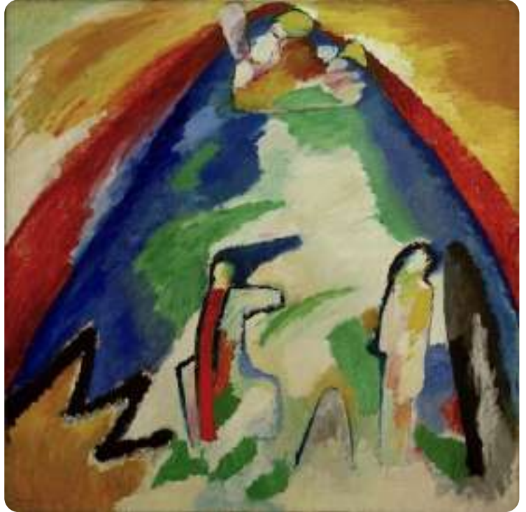
Vassily Kandinsky, Montagne, 1909; Huile sur toile • 109 × 109 cm Coll. Städtische Galerie im Lenbachhaus, Munich

Peintre russe considéré comme l'un des pionniers de l'art abstrait. Il cherchait à représenter les émotions et les sensations à travers des formes, des couleurs et des lignes, sans forcément montrer des objets réels. Kandinsky aimait beaucoup la musique, qu'il voyait comme une source d'inspiration : il pensait que la peinture pouvait, comme la musique, toucher directement les émotions. C'est pourquoi ses œuvres ressemblent souvent à des compositions musicales, avec des rythmes, des couleurs qui dansent, et des formes qui vibrent.