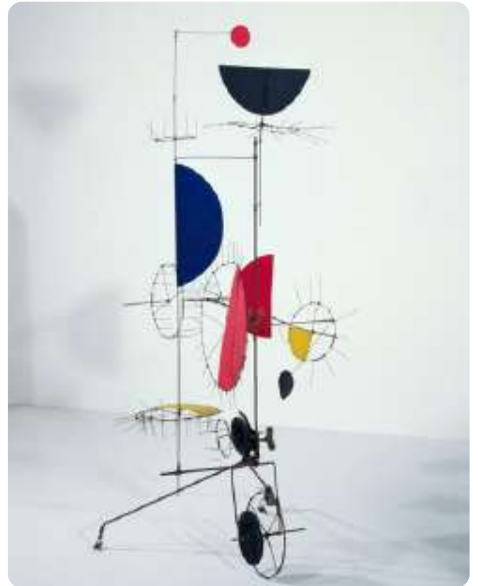
© Adagp, Paris. Crédit photographique : Centre Pompidou, MNAM-CCI/Service de la documentation photographique du MNAM/Dist. GrandPalaisRmn. Réf. image : 4RO6128 [1982 CX 0119]

Artiste suisse connu pour ses machines artistiques pleines de bruit, de mouvement et d'humour. Il construisait des sculptures mécaniques, souvent faites à partir de matériaux de récupération : vieux moteurs, roues de vélo, pièces métalliques rouillées... Ses œuvres, qu'il appelait parfois des « machines inutiles », bougeaient, cliquetaient, tournaient, et parfois même se détruisaient elles-mêmes. Tinguely cherchait à montrer que la machine, au lieu d'être sérieuse et utile, pouvait devenir poétique, drôle ou absurde. Il est l'un des grands noms de l'art cinétique et un précurseur de l'art interactif.