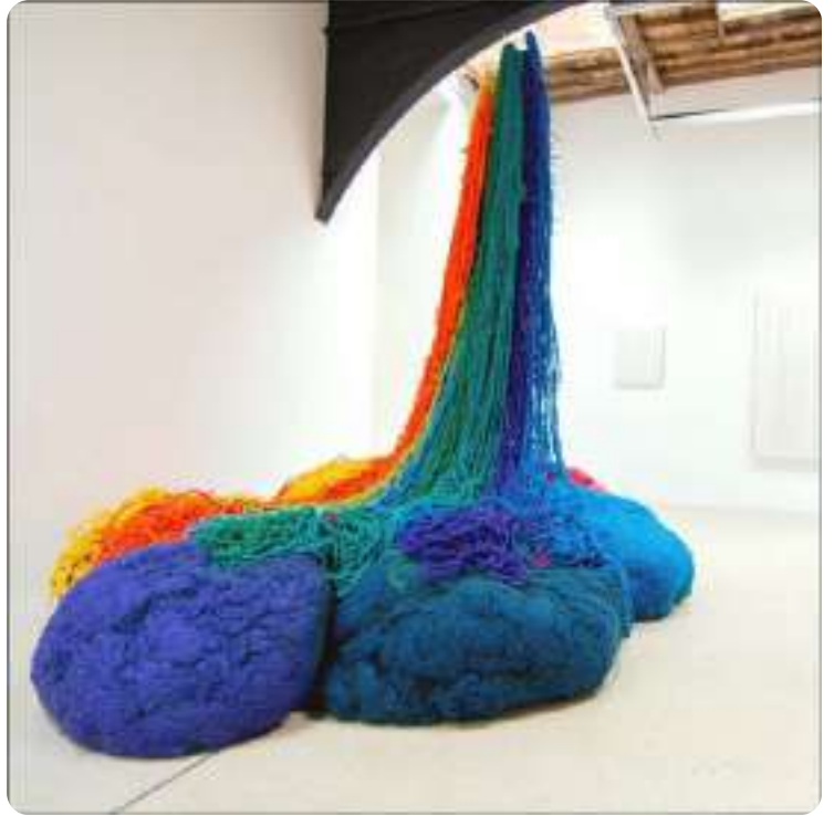
Sheila Hicks. Atterrissage, 2014. Sculpture. Pigments, fibre acryliques. Vue de l'exposition

Artiste américaine reconnue pour son travail autour du fil, du textile et de la couleur. Elle crée des œuvres qui vont de la petite sculpture textile à de grandes installations immersives, souvent faites à la main avec des fibres naturelles ou colorées. Son travail mêle traditions artisanales venues du monde entier et expérimentation contemporaine, en jouant sur les textures, les formes et les volumes. Sheila Hicks a contribué à faire entrer l'art textile dans le monde de l'art contemporain, en brouillant les frontières entre art, design et artisanat.